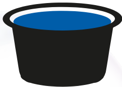
Posode / korita za pitje