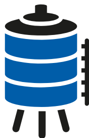
Rezervoarji za vodo